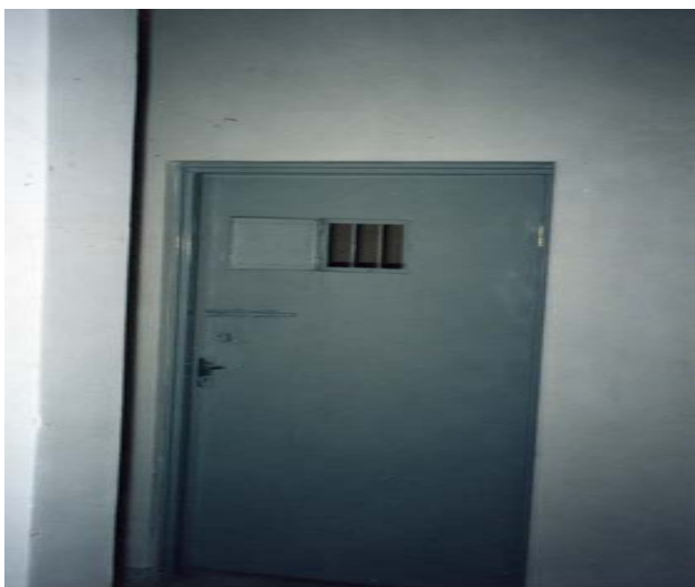
ئە مە شىوہى دە رگاى (زىندانە)

يەك يەك ناويان دەخوئىندىنەو دەيان كردين بە ژوردا. ژورىكى 4 × 5 بوو، دەرگاگەى لە ناوہراستدا بەشى سەرەوہى دەرگاگەى بچوكى